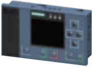
Gelişmiş HMI Modülü

Tablodaki güç değerleri CLASS 10A termik açma sınıfına göre düzenlenmiştir. Ağır yol alma şartlarında (CLASS 20 / CLASS 30) cihaz seçimi için teknik desteğe danışabilirsiniz.