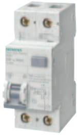
5SU13... 5SU16... 5SU67...